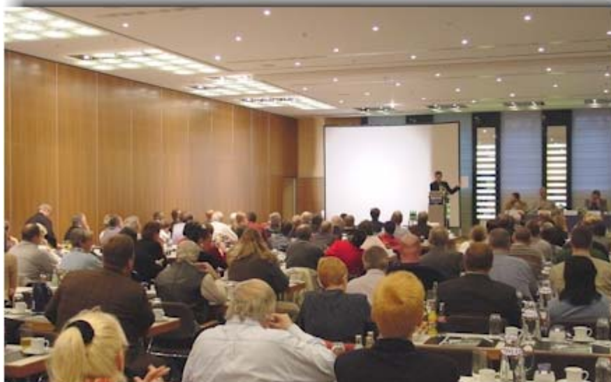
Vorbereitet: Gemeinsam zur Berliner dbb-Demonstration am 14. Dezember 2002

Mit unterschiedlichen Redebeiträgen und Anfragen aus den einzelnen Fachgewerkschaften endete am frühen Abend die dbb-Konferenz der Beschäftigtenvertretungen im Schweizer Hof.